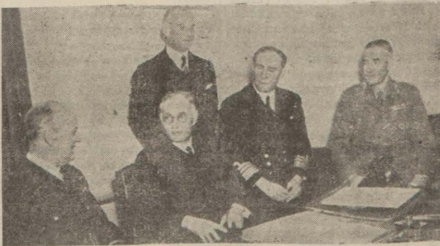
Avustralya başvekil Avustralya deniz, kara ve hava kuvvetleri erkânı ile konuşurken

Vaşington, 9 (A.A.) — Avustralya tebliği: Müttefiklere ağır kayıplar verildiğini tefahürle bildiren Japon tebliğlerini yalanlamakta ve bu deniz muharebesine aid Japon iddialarının hakikate tamamen aykırı bulunduğunu ve sırf propaganda mahiyetinde telâkki edilmesi lâzım (Devamı 5 inci sayfada)