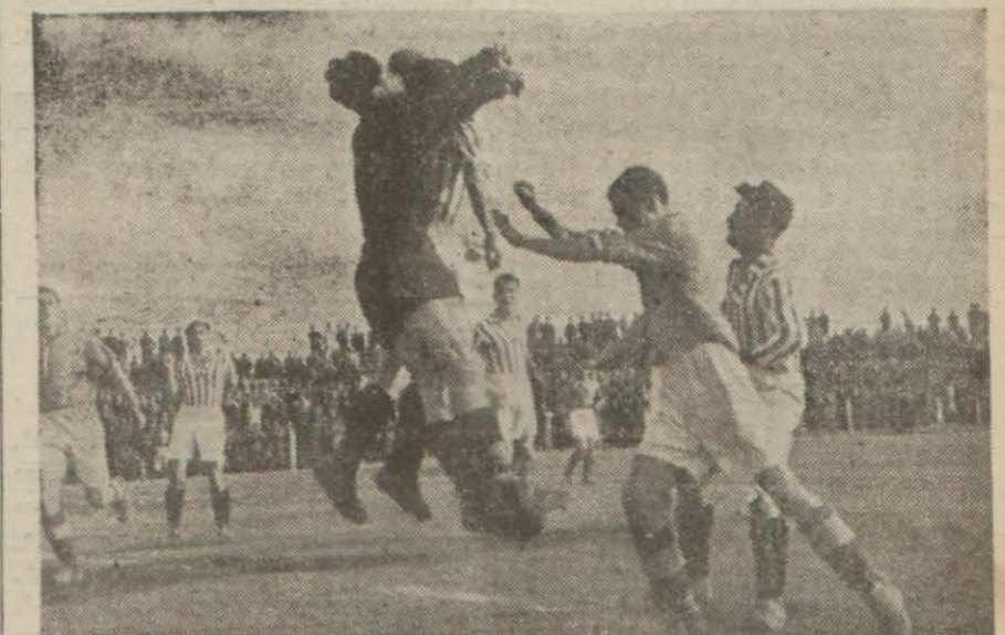
Dünkü maçtan bir intiba

Romanyanın Rapit takımı Fe-kazandı. İnsafli konuşmak lâzım nerbahçeyi 1.0 yendikten sonra Be-gelirse Rapit taktımı, şehrimize ge-siktaşla 2.2 berabere kalmıştı. Dün-len takımların en talihlisidir, de-de Galatasarayla yaptığı maçı 1.0 (Devamı 4/2 de)